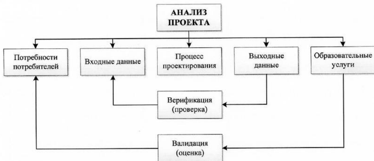
Рисунок 2 – Соотношение анализа, верификации и валидации проектов образовательных программ

Верификация проекта и разработки ОП в РУТ (МИИТ) осуществляется УМУ по окончании процесса проектирования ОП. УП проходят экспертизу, о чем делаются соответствующая запись в учебном плане.